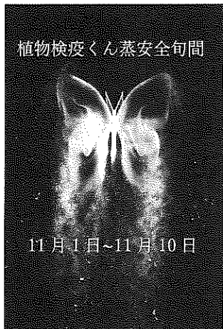
優秀作品 森裕一 (関東燻蒸)