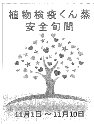
優秀作品(九州協会 奥 直人)